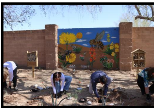
Mural con Jardín polinizador en Universidad Tecnológica de Hermosillo.

Con el fin de promover la conservación de los polinizadores y la biodiversidad mediante el uso de plantas nativas que favorezcan la polinización, mejoren la calidad ambiental, fortaleciendo así ecosistemas saludables y sostenibles.