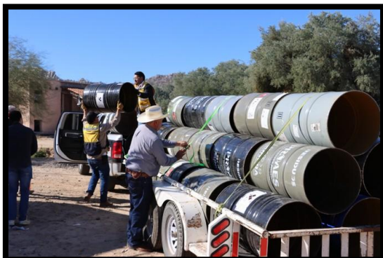
Entrega de Contenedores en el H. Ayuntamiento de Divisaderos.

Se distribuyeron 595 contenedores con el objetivo de fortalecer la correcta disposición final de los residuos y contribuir a la mejora de la gestión ambiental en las comunidades beneficiadas.