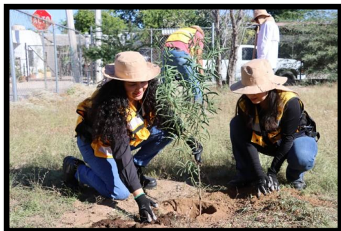
Arborización en Escuela Adolfo López Mateos en Hermosillo, Sonora.